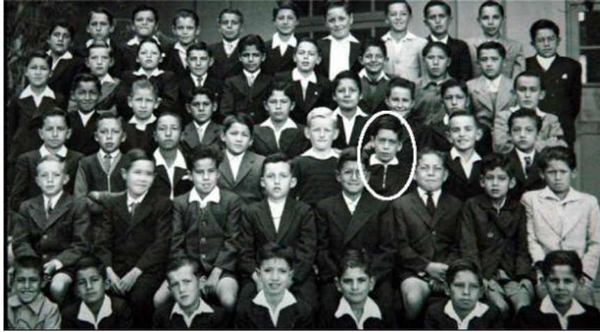
La fotografía es de 1945-clase de primaria –Col. La Salle (Cochabamba)

cogidos de las manos, en rondas, deletrear, identificar las sílabas en cada palabra, reproducirlas y memorizarlas”. Desde aquí le felicitamos y nos felicitamos.