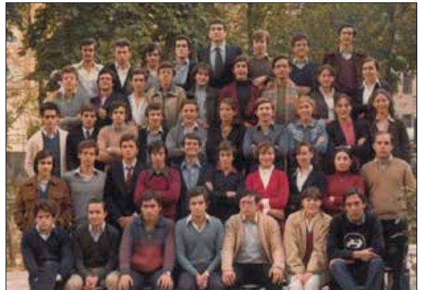
Cou A promoción 1978-79

Aprendimos, muchas, a jugar al mus, y a gastar las preciosas horas libres en esos menesteres, a leer libros de adultos que iban de boca en boca entre los compañeros: Sartre, Camús, Herman Hesse.....si nuestras monjas vieran