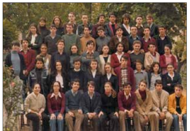
Cou C promoción 1978-79