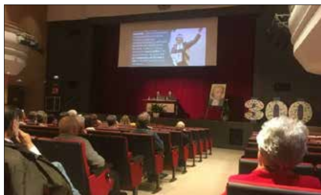
Vista del teatro del Colegio en una de las conferencias