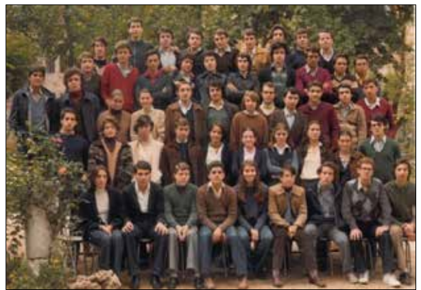
Cou B promoción 1978-79