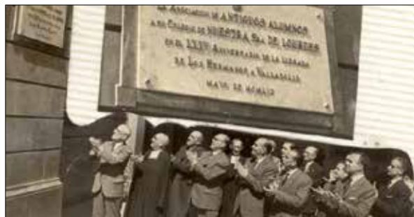
Colocación de la placa en 1959