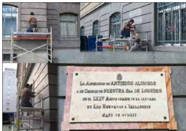
Trabajos de restauración de las placas