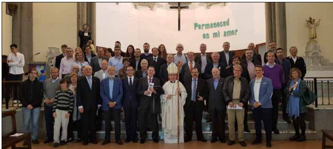
Algunos de los asistentes al VIII día del Antiguo Alumno