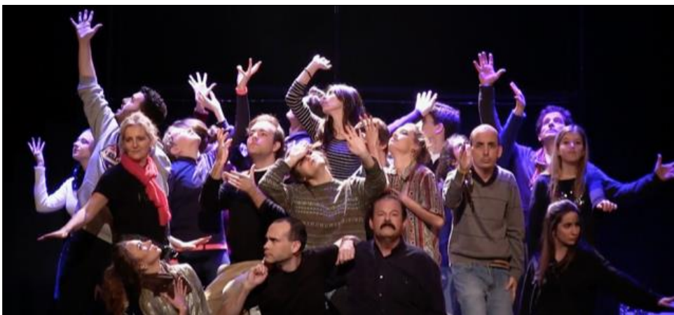
Los miembros del grupo Siluetas