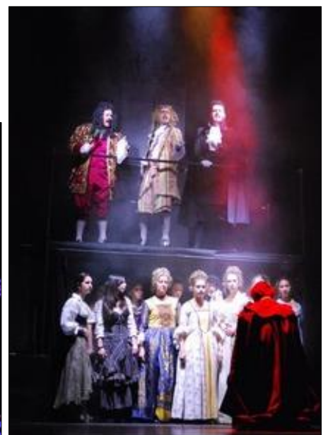
Pasajes de la Obra